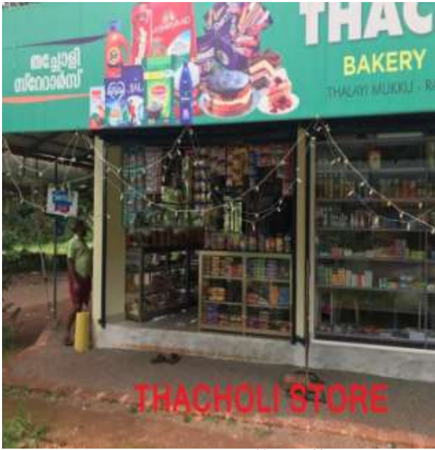
തച്ചോളി സ്റ്റോർ- തലായ്മുക്ക്