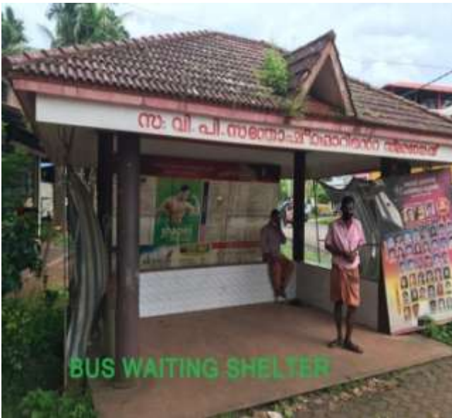
ബസ്സ് കാത്തിരിപ്പ് കേന്ദ്രം -തലായ്മുക്ക്