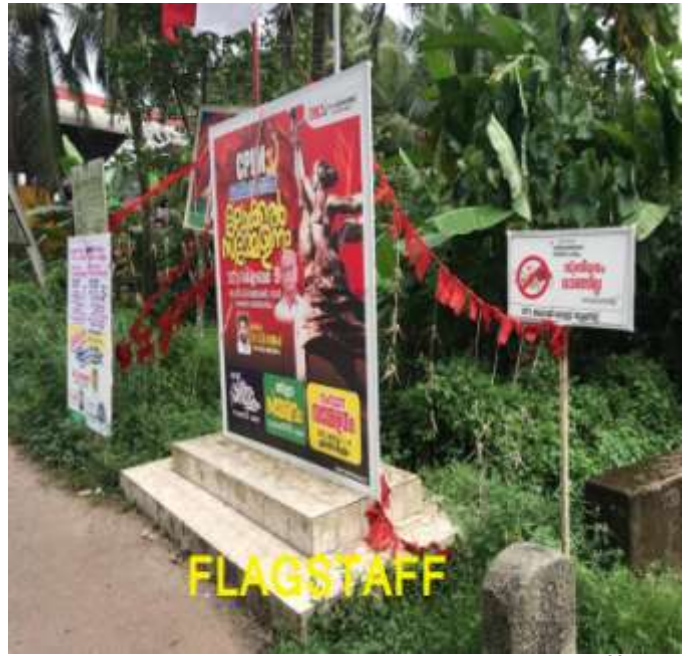
കൊടി മരം - തലായാമുക്ക്