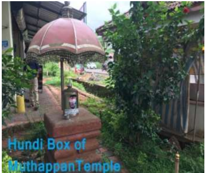
മുത്തപ്പൻ ക്ഷേത്ര ഭണ്ഡാരം-തലായ്മുക്ക്