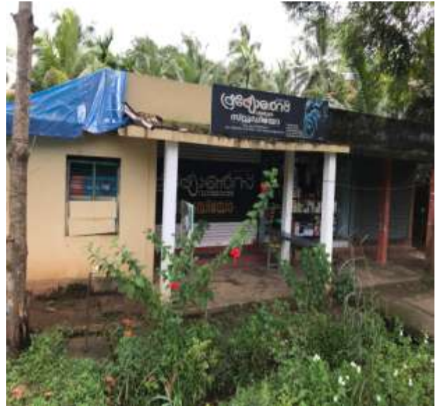
മൂന്ന് മുറി പീടിക- തലായ്