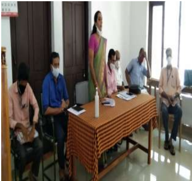
പഞ്ചായത്ത് പ്രസിഡent ശ്രീമതി പ്രാർത്ഥന ഉദ്ഘാടനം ചെയ്യുന്നു