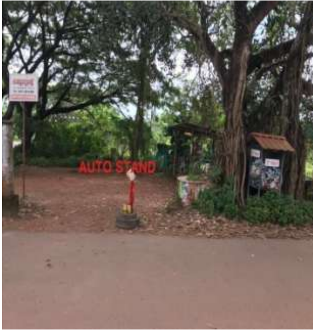
ഓട്ടോ സ്റ്റാന്റ് - തലായ്മുക്ക്