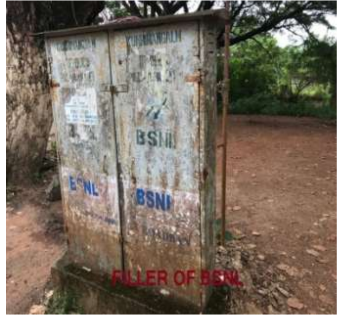
BSNL ഫില്ലർ- തലായ്മുക്ക്