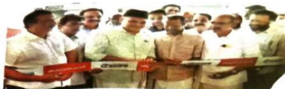
കണ്ണൂർ ജില്ലയിൽ വിദ്യാഭ്യാസ വകുപ്പിന്റെ അദ്ധ്യക്ഷൻമാർ ഉദ്ഘാടനം നടത്തിയത്.

വി.എച്ച് സ്മിത്ത് വനിതാ ഇൻസ്റ്റിറ്റ്യൂട്ട് സന്തതി കോഴിക്കോട് വെ.പി. കോ. സി.എച്ച്. സെന്റേഴ്സ് വനിതാ ഇൻസ്റ്റിറ്റ്യൂട്ട് സന്തതി സമാഹരിച്ചിട്ടുള്ള കോളേജിൽ വെച്ച് വിദ്യാഭ്യാസ വകുപ്പിന്റെ അദ്ധ്യക്ഷൻമാർ ഉദ്ഘാടനം നടത്തിയത്. വി.എച്ച് സ്മിത്ത് വനിതാ ഇൻസ്റ്റിറ്റ്യൂട്ടിന്റെ ഭവനത്തിൽ വിദ്യാഭ്യാസ വകുപ്പിന്റെ അദ്ധ്യക്ഷൻമാർ ഉദ്ഘാടനം നടത്തിയത്. കോഴിക്കോട് വെ.പി. കോ. സി.എച്ച്. സെന്റേഴ്സ് വനിതാ ഇൻസ്റ്റിറ്റ്യൂട്ടിന്റെ ഭവനത്തിൽ വിദ്യാഭ്യാസ വകുപ്പിന്റെ അദ്ധ്യക്ഷൻമാർ ഉദ്ഘാടനം നടത്തിയത്. കോഴിക്കോട് വെ.പി. കോ. സി.എച്ച്. സെന്റേഴ്സ് വനിതാ ഇൻസ്റ്റിറ്റ്യൂട്ടിന്റെ ഭവനത്തിൽ വിദ്യാഭ്യാസ വകുപ്പിന്റെ അദ്ധ്യക്ഷൻമാർ ഉദ്ഘാടനം നടത്തിയത്.