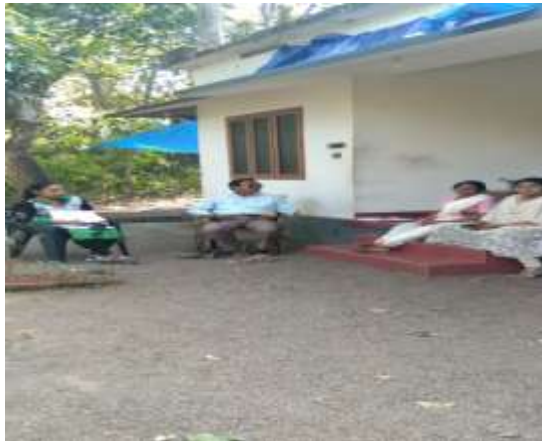
ഭൂ ഉടമകളുമായുള്ള ചർച്ച

ഏറ്റെടുക്കാൻ ഉദ്ദേശിക്കുന്ന സ്ഥലത്തിന്റെ വിവിധ ദൃശ്യങ്ങൾ